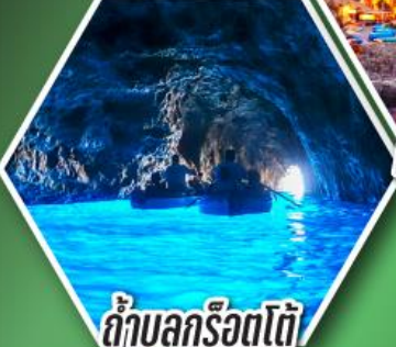
ถ้ำบลูกร็อตโต้