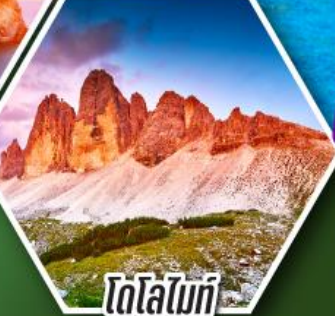
โตโลไมท์