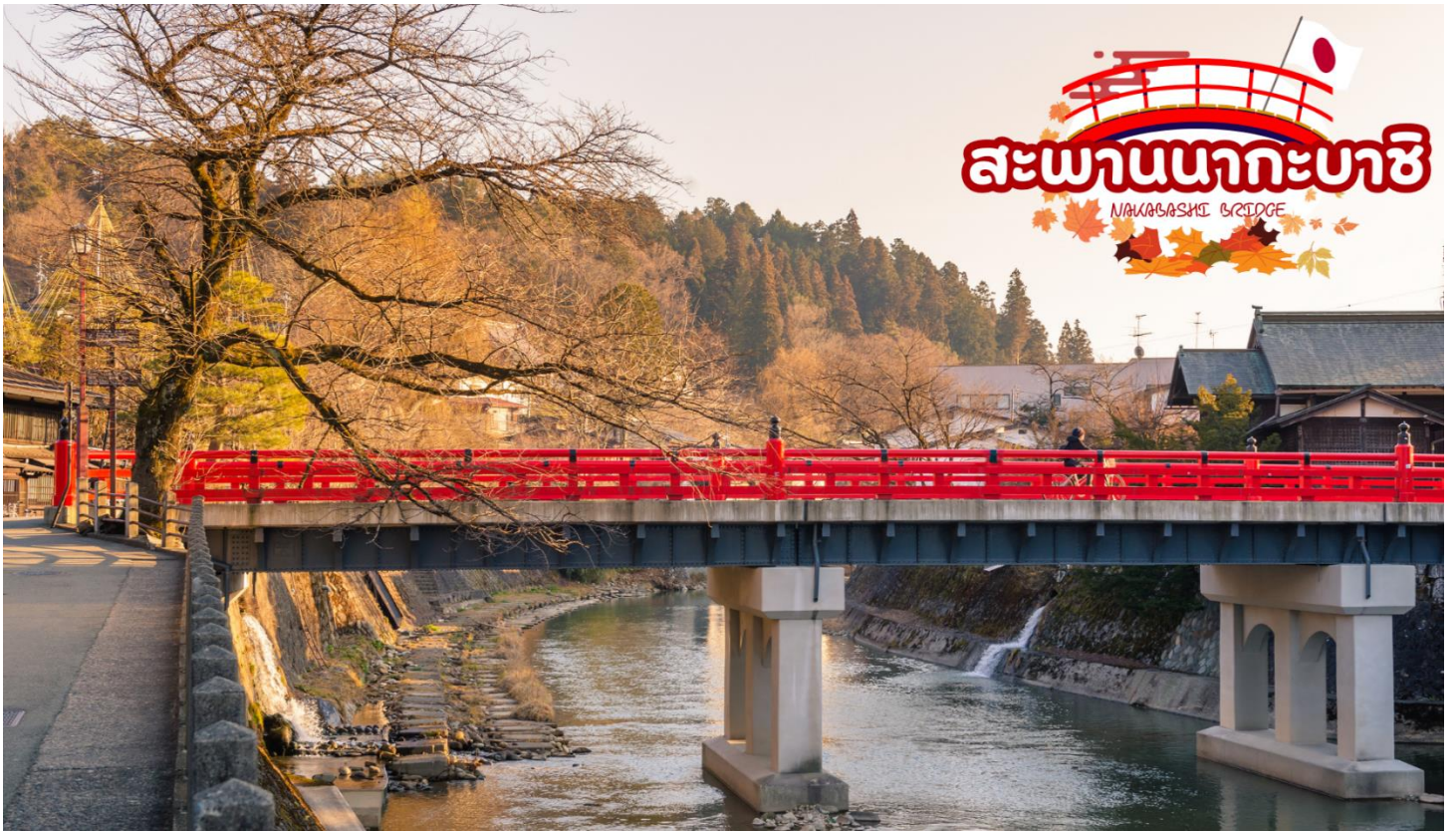
สะพานนากะบาชิ (Nakabashi Bridge) สะพานสีแดงของย่านเมืองเก่า สะพานทอดข้ามแม่น้ำมิกากาวะที่ไหลผ่านใจกลางเมือง สะพานแห่งนี้ถือเป็นสัญลักษณ์ของเมืองทาคายาม่า