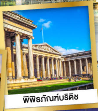
พิพิธภัณฑ์บริติช