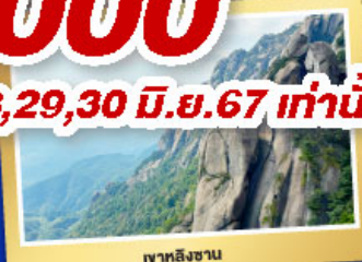
เทวหลิงซาน