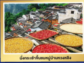
มัสการเจ้าซันซันหมู่บ้านทวดหลิง