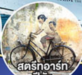
สตรีทอาร์ต ปีนัง