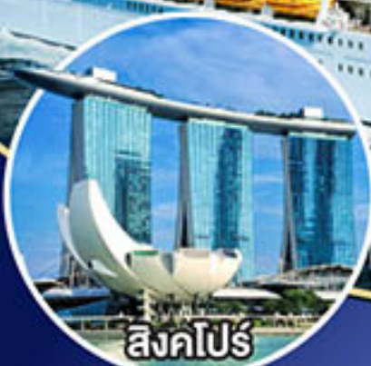
สิงคโปร์