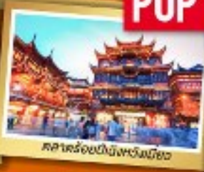
ศาลาร้อยปีปักกิ่งหนิงเฉียว