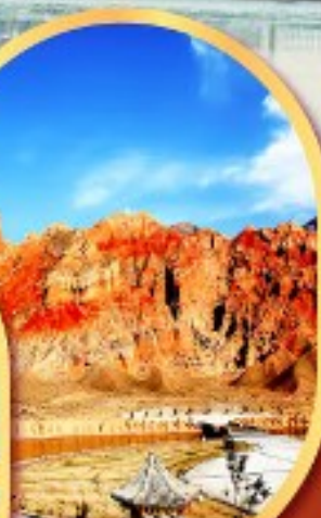
หุบเขาห่าสี อุทยานธรณีกุยเต๋อ