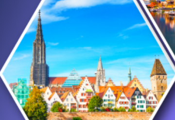
อูล์มบ้านเกิดไอน์สไตน์