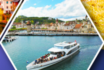
ล่องเรือทะเลสาบลูเซิร์น

การ์นตี แพ็คเกจข้ามบนยอดเขาพีลาตุส ยอดเขาคินมิงกรแห่งสวิตเซอร์แลนด์