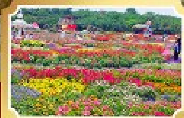
สวนสวรรค์แห่งคูหมี (Wentuo Minor)