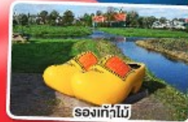
เรือกั๊กไม้