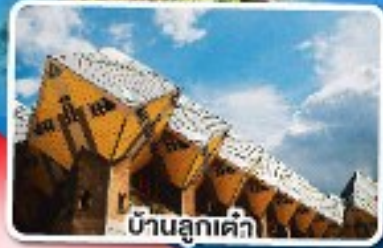
บ้านลูกเต้า