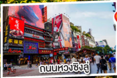
ถนนหวงซิงฉู่