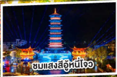
ชมแสงสีอุโมงค์