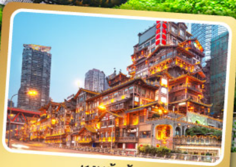
หงหย้าต้ง