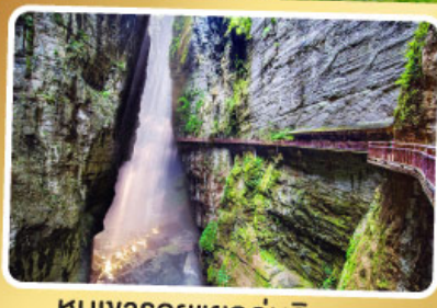
หุบเขารอยแยกอู่หลิงซาน