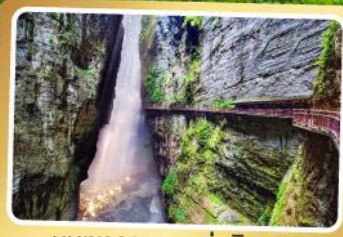
หุบเขารอยแยกอู่หลิงซาน