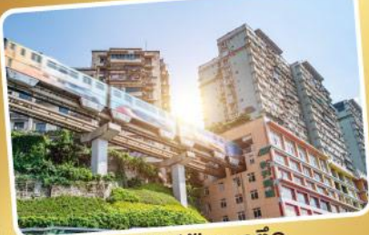
สถานีไฟฟ้ากระสุนตึก