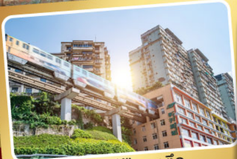
รถไฟฟ้าทะลุตึก

**เงื่อนไขเป็นไปตามที่บริษัทฯกำหนด ความคุ้มครองขึ้นอยู่กับแผนประกันภัย