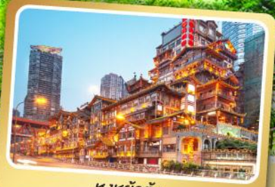
หงหย้าตัง