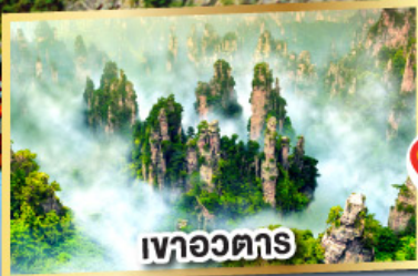
เขาวงตาร