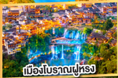
เมืองโบราณฟูหรง