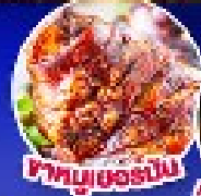
ไก่อบเยอรมัน