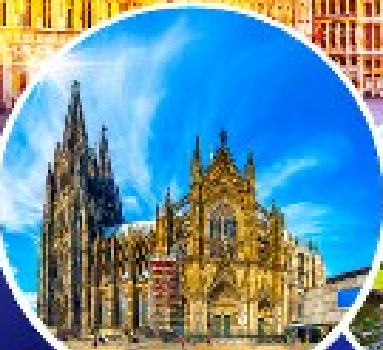
มหาวิหารแห่งโคโลญ