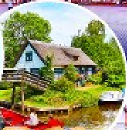
หมู่บ้านกีธูร์น