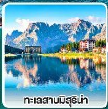
ทะเลสาบมิสุรีน่า

เข้าชมมหาวิหารเซนต์ปีเตอร์ ที่ใหญ่ที่สุดในโลกแห่งนครวาติกัน