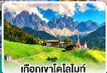
เทือกเขาโดโลไมท์