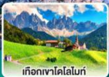
เทือกเขาโดโลไมท์