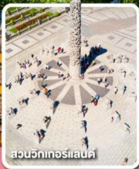
สวนวิกทอร์แลนด