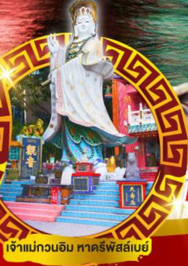
วัดเจ้าแม่กวนอิมฮ่องอ่ำ