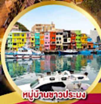
หมู่บ้านชาวประมง