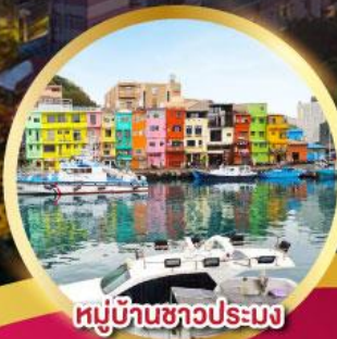
หมู่บ้านชาวประมง