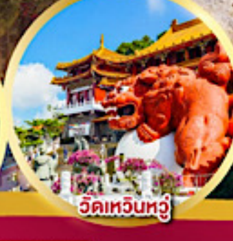
วัดเหวินหู่