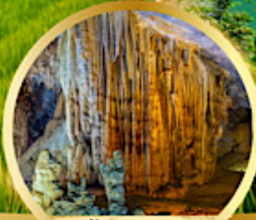
ถ้ำสวรรค์