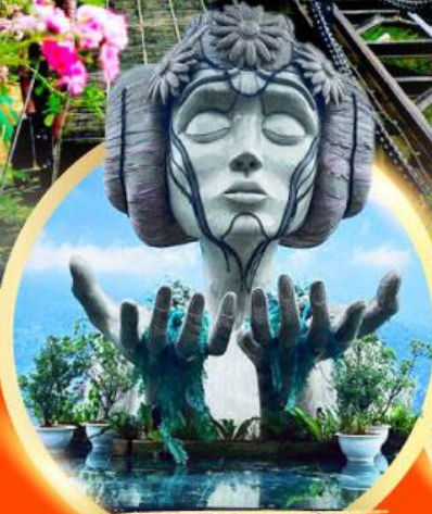
โมนาน่า ซาปา คาเฟ่