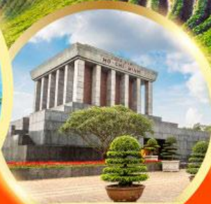
สุสานโฮจิมินห์