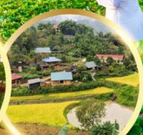
หมู่บ้านกัตกัต