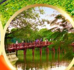
ทะเลสาบคินดาบ