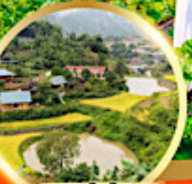
หมู่บ้านก๊วกก๊ต