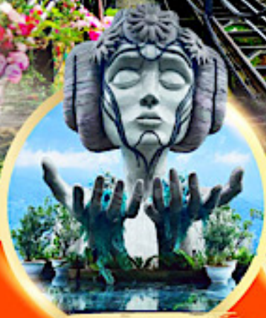
โมอาน่า ซาปา คาเฟ่