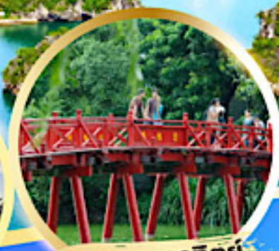
สะพานแสงอาทิตย์