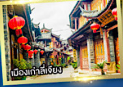
เมืองเก่าลี่เจียง