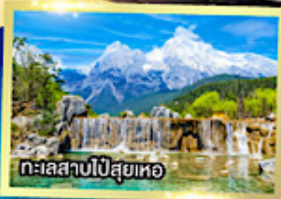
ทะเลสาบไป๋สือเหอ