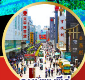
ถนนชุนชี่ลู่

-เมนูพิเศษ สุกี้หมาล่าเสฉวน , เปิดปิกนิก