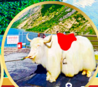
ทะเลสาปเตี้ยซี