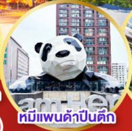
หมีแพนด้าปิ่นตึก