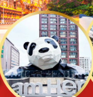
หมีแพนด้าปิ่นตึก