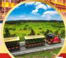
อุทยานเขานางฟ้า