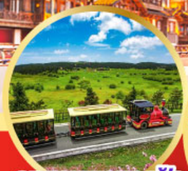
อุทยานเขานางฟ้า