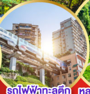
รถไฟฟ้าทะลุติ๊ก หลุมฟ้าสะพานสวรรค์