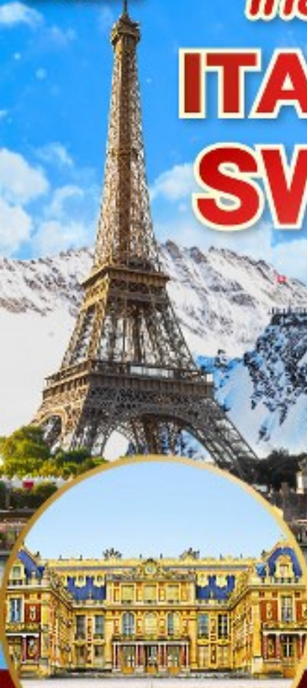
พระราชวังแวร์ซาย