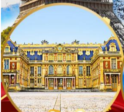
พระราชวังแวร์ซาย