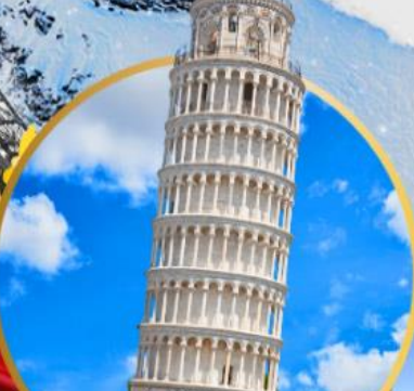
หออนปีซ่า