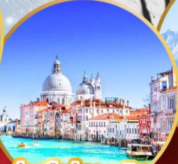
ล่องเรือสู่เกาะเวนิส