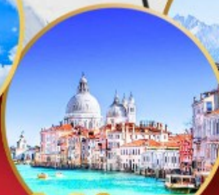
ล่องเรือสู่เกาะเวนิส