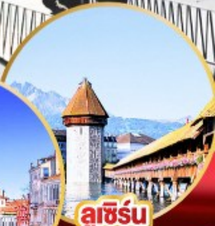
ลูซิิร์น