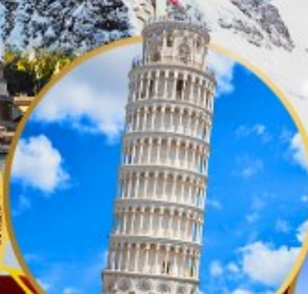
หอเอนปิซ่า