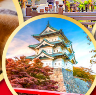
ปราสาทอิโรซากิ