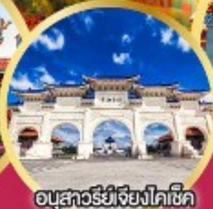
อนุสาวรีย์เจียงไคเช็ค