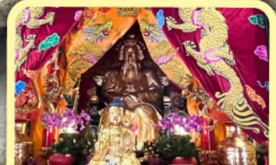
• เอียงบูซิว (ศาลเจ้าพ่อเสือ)