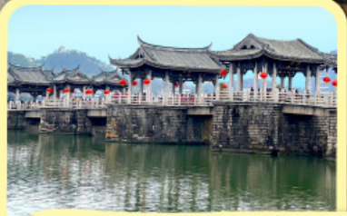
• สะพานโบราณกว่างจี