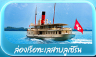
คองเรือทะเลสาบลูเซิร์น

ซูริก โลซาน เวอว์ย เซอร์แมท ลูเซิร์น ริก