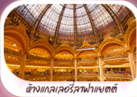
ห้างแกลเลอรีลูฟวร์