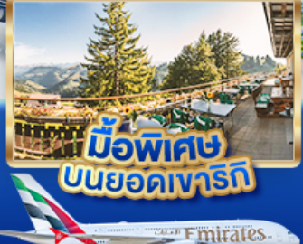
มือพิเศษ บนยอดเขารัก