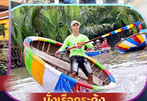
นั่งเรือกระดง