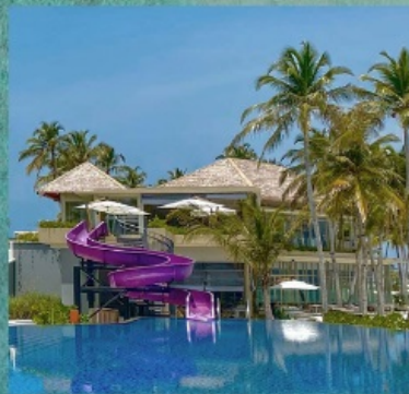
Main Pool with Slider