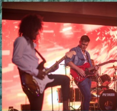
Hard Rock Cafe