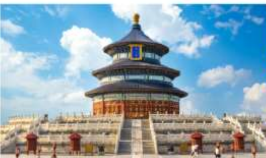
หอบูชาฟ้าเทียนถาน