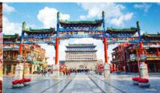
ถนนโบราณเจียนเหมิน

*ทางบริษัทฯ ขอสงวนสิทธิ์ในการสลับโปรแกรมทัวร์ตามความเหมาะสมขึ้นอยู่กับสถานการณ์หน่วยงาน โดยคำนึงถึงผลประโยชน์ของลูกค้าเป็นสำคัญ