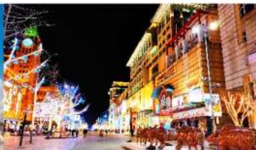
ถนนหวังฝูจิ่ง