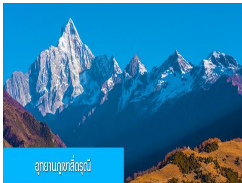
อุทยานภูเขาสี่ดรุณี

หลังอาหารนำท่านเที่ยวชม หุบเขาชวงเฉียวโกว 双桥沟景区 ที่เป็นแหล่งท่องเที่ยวที่สวยงามที่สุดแห่งหนึ่งในเขตอุทยานภูเขาสี่ดรุณี นำท่านนั่งรถบัสของอุทยานที่วิ่งไปผ่านเส้นทางที่สร้างคู่ขนานกับลำธารกษยในหุบเขา ท่านจะได้สัมผัสกับความสวยงามของทัศนียภาพธรรมชาติที่หาชมได้ยาก โดยมีภูเขาหิมะสูงตระหง่านอยู่เบื้องหลัง ธารน้ำใสไหลริน และสระน้ำที่มีสีเขียวมรกต ในฤดูใบไม้ผลิและฤดูร้อนท่านจะได้เห็นฝูงจามรีท่ามกลางทุ่งหญ้าเขียวขจี ส่วนในฤดูหนาวทุ่งหญ้าและพื้นดินจะปกคลุมด้วยพรมหิมะสีขาว....รถบัสของอุทยานจะนำนักท่องเที่ยวไปยังจุดชมวิวสำคัญต่าง ๆ ภายในเขตอุทยาน เพื่อให้นักท่องเที่ยวได้เที่ยวชมสถานที่และถ่ายรูปไปตามอัธยาศัย จนครบแ่เวลา นำคณะขึ้นรถบัสออกจากอุทยาน