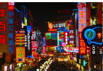
ถนนคนเดินซุนซีลู่