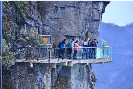
หน้าพลาวยี่ท้าวเดินกระจก