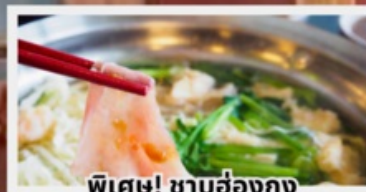
พิเศษ! ซาบูฮ่องกง