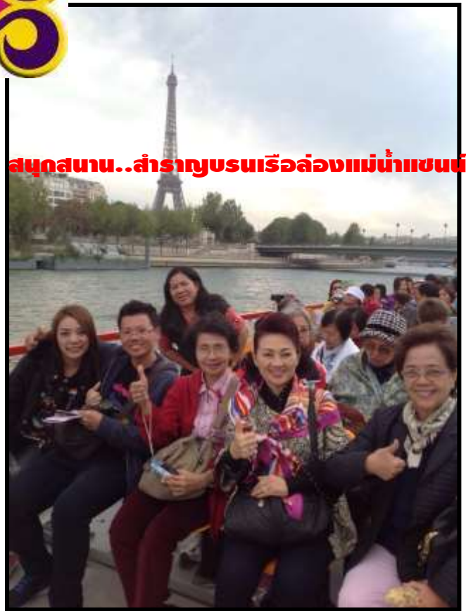
สนุกสนาน..สำราญชมเรือล่องแม่น้ำแซน

เรากำลังรอรับเกียรติจากทางท่าน...มาใช้บริการทัวร์ที่ดีจากทางเรา