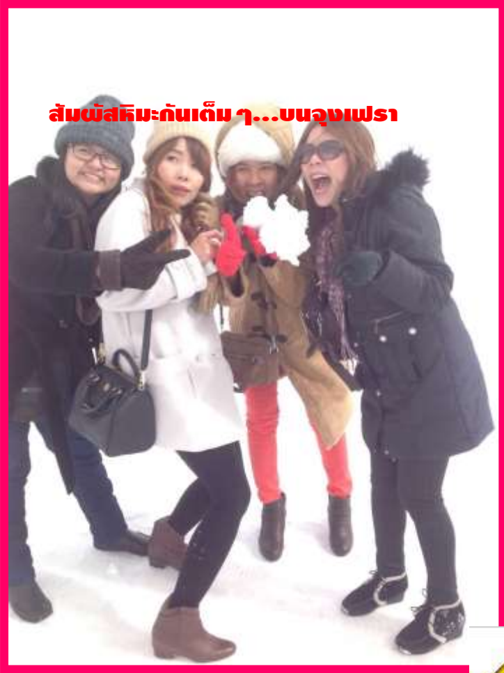
สัมผัสหิมะกันเต็ม ๆ...บนจุงเฟรา