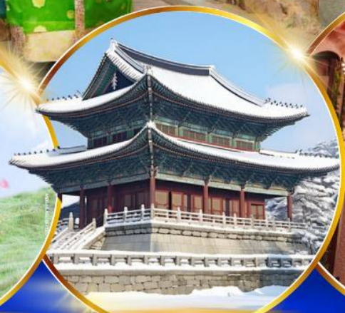
พระราชวังเคียงบกคุง