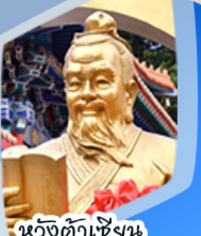
หนัจตั้งเซ็งน