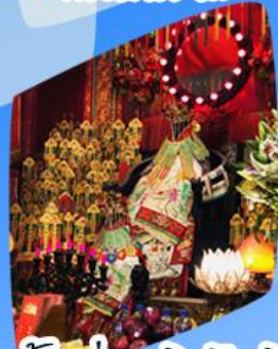
เจ้าแม่กวนอิมจีมเงิน