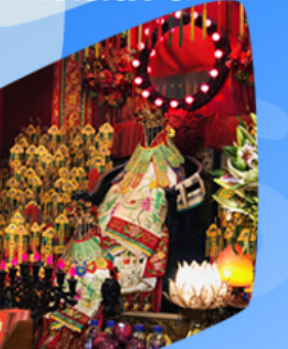
เจ้าแม่กวนอิมซี่มเงิน

วัดอาม่า เจ้าแม่กวนอิมรีมทะเล วัดเจ้าแม่กวนอิมมาแก้ว