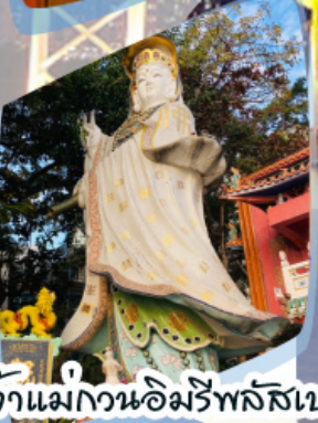
เจ้าแม่กวนอิมรีพลัสเบง