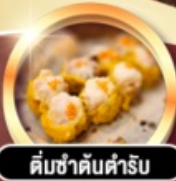
ติ่มซำคันท้ารับ