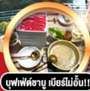
บุฟเฟ่ต์ชาบู เมียร์โมอัน!!