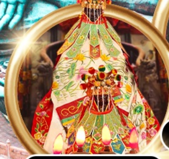
ยืมเงินเจ้าแม่กวนอิมสองห้า