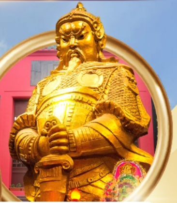
วัดแชกงหมิว