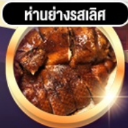
ห่านย่างรสเลิศ