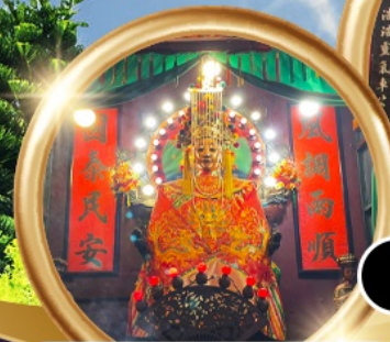
ขอพรซื้อขายอสังหาริมทรัพย์