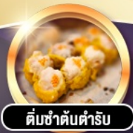
ติ่มซำต้นตำรับ