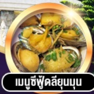
เมนูซีฟู้ดลิ้นมดุน