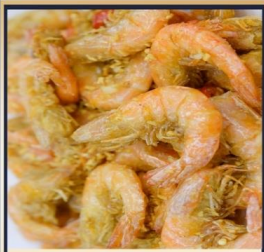
กุ้งทอดกระเทียม