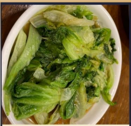
ผัดผักตามฤดูกาล