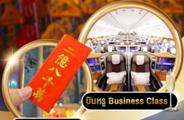
บินหรู Business Class