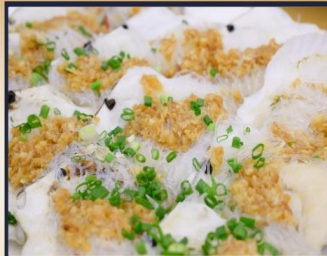
หอยเชลล์อบวุ้นเส้น