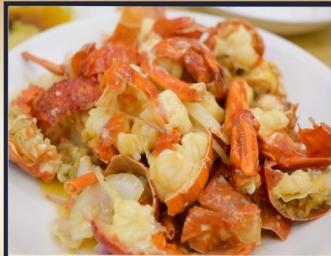
กุ้งมังกรอบซีส