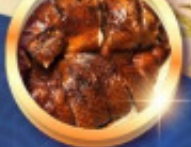
ทำอย่างรสเลิศ