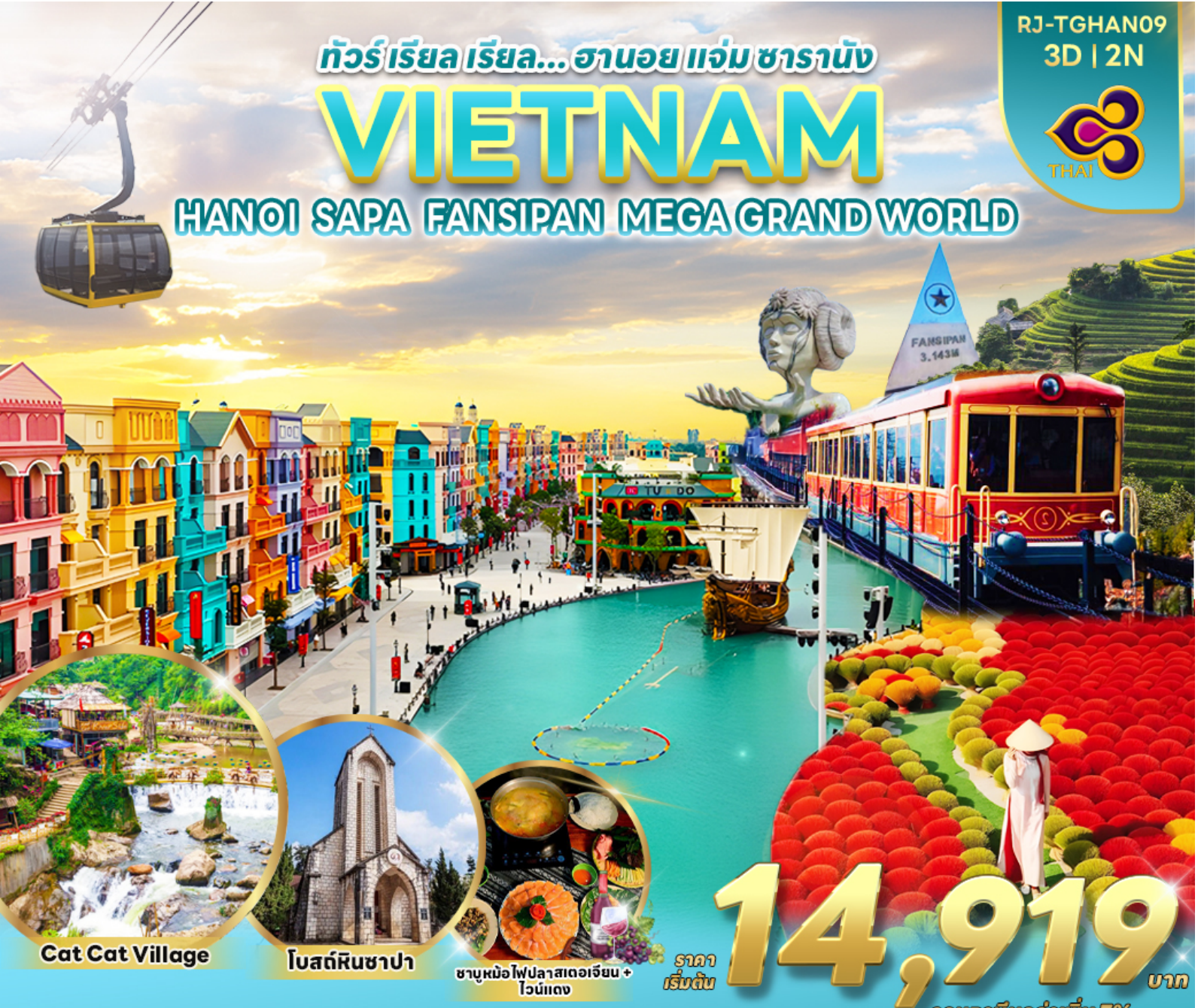
Cat Cat Village