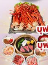
บุฟเฟต์ ชาปู 1 มื้อ

ราคา เริ่มต้น 39,919 บาท รวมภาษีมูลค่าเพิ่ม 7%