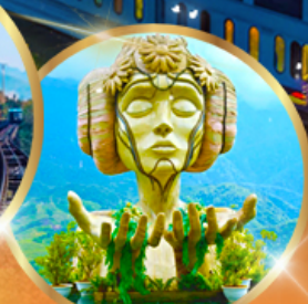
โมนาน่า คาเฟ่