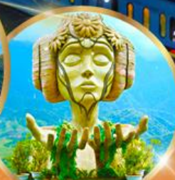
โมนาน่า คาเฟ่