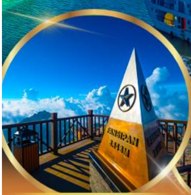
ยอดเขาฟานซีปัน

พักโรงแรม ★★★★★ GRAND SILK PATH SAPA HOTEL 2 คืน ROYAL CASINO HALONG HOTEL 1 คืน