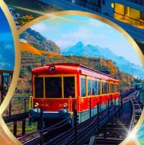
รถราง ซาปา