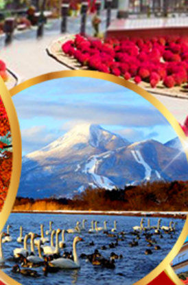
ทะเลสาบอินาวะชิโระ