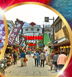
ย่านโบราณ ชิบูมาตะ