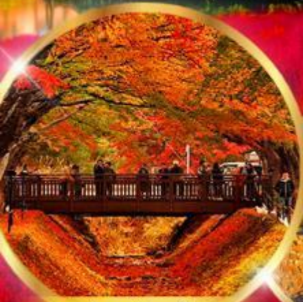
อุโมงค์เมเปิ้ล