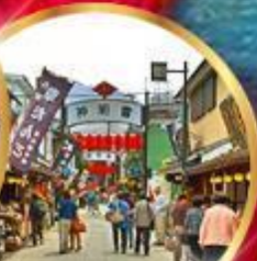
ย่านโบราณ ชิชะมาตะ