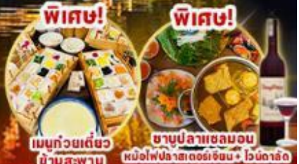
เมนูถ้วยเต๋ยว ซ้ำนสะพาน