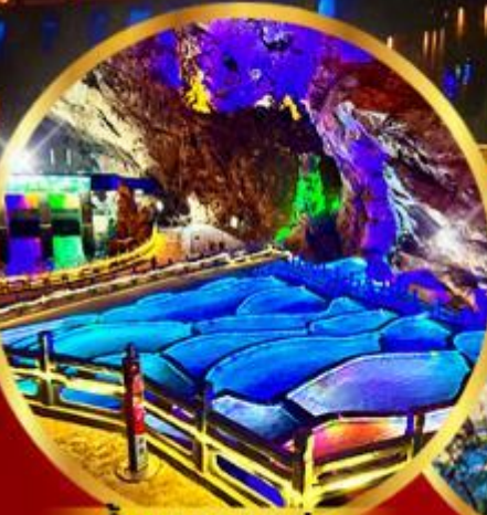
ด่านกนางแอ่น