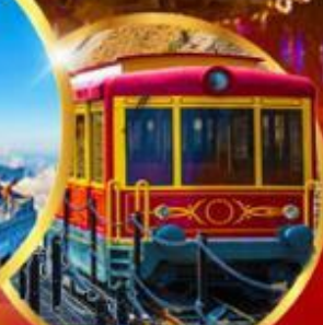
รถรางซาปา